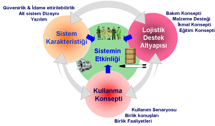
Şekil-2: Silâh Sistemlerin Harekât Etkinliğine Etki Eden Unsurlar

Belirtilen sebeplerle dış tedarik, ülke açısından kritik olan pek çok alanda dışa bağımlılığın da temelini oluşturmaktadır. Oluşacak dışa bağımlılık çeşitleri sadece bu kadarla sınırlı değildir ve sistemsel bazda da kalmayabilir.